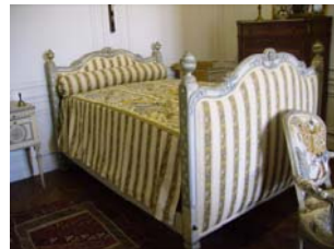
Sur un lit