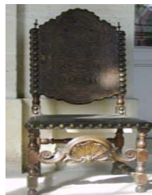
Sur une chaise