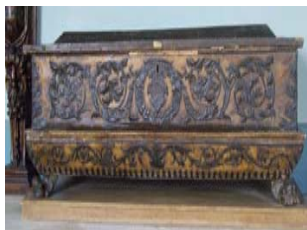
Sur un coffre

Où se trouve ce livre qui s'appelle « La Bible » ? Entoure.